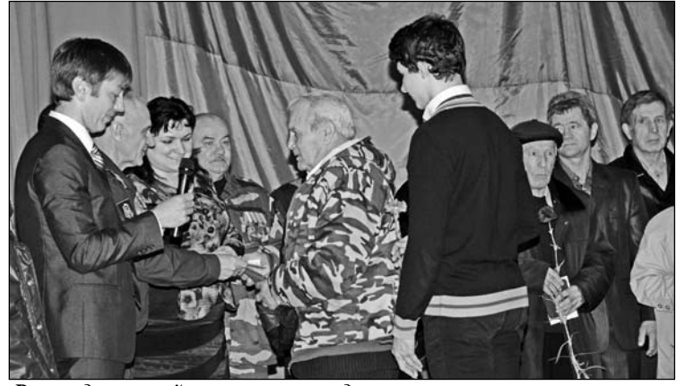
Руководство района вручает медали ветеранам.