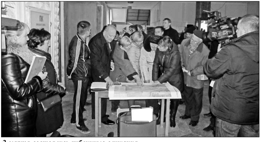
2 марта состоялись публичные слушания по строительству и эксплуатации ТЭС